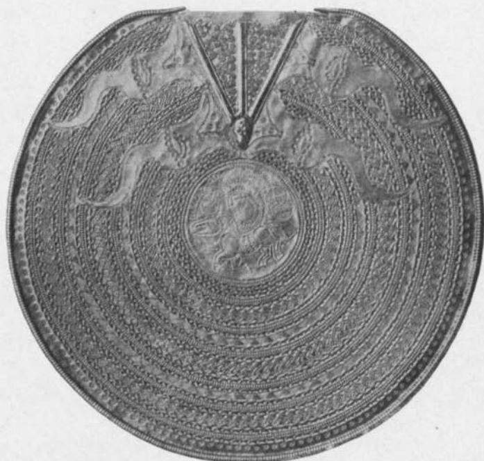
Fig. 103. Guldbrakteat. Södra Åsum, Färs hd, Skåne. S. H. M. 7128. \frac{3}{4} .

fragment av en brakteat, Atlas 146, vilken haft en diameter av omkring 106 mm. Men detta smycke har redan under forntiden blivit styckat i ett flertal delar. Tre bitar återfunnos på en utmark till Rönne och den fjärde långt senare jämte bysantinska mynt och andra guldföremål vid Sandegaard i Aaker sn, drygt en mil från de tre andra bitarnas fyndplats.