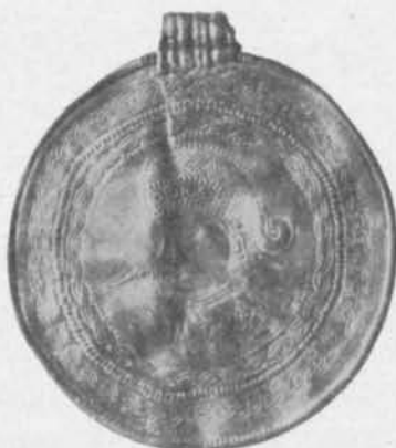
Fig. 112. Guldbrakteat. Tjusby, Gärdlösa sn, Öland. S. H. M. 2725. \frac{1}{4} .

historiska museum ännu en brakteat, slagen i samma stans som den från Ravlunda, men utan den senares breda stämpelbård,