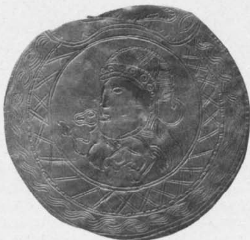
Fig. 108. Graverad guldplåt. Vä. Se fig. 6. S. H. M. 67. 1/1.