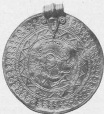
Fig. 109. Guldbrakeat. Fride, Lojsta sn, Gotland. S. H. M. 1088. \frac{1}{1} .

i regel tydligt klassiskt ursprung. De återstående fem nordiska arbetena med dylika ansiktsmasker äro alla brakteater, nämligen de ovan avbildade från Ravlunda och Dödevi med nio (ursprungligen tio) masker i fyra rader, resp. tre masker i två rader inom den triangulära fliken under ögla, vidare brakteaten fig. 109 från Fride i Lojsta sn