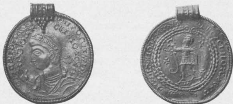
Fig. 110 och 111. Ömse sidor av en medaljefterbildning. Guld. Lilla Jored, Kville sn, Bohuslän. S. H. M. 421. \frac{1}{4} .

grupp även förlorat halsen, medan denna möjligen bevarats, för att snart förvandlas till en hel bål, inom en eventuell parallellserie) att vila direkt på det i vida mindre skala tecknade fyrfotadjurets rygg. Ju mer manshuvudets (och djurbildens) form framhäves genom relief och ju mindre detta uttrycksmedel kompletterats med eller ersatts av upphöjda (i stansen urgrävda) konturlinjer, dess ursprungligare är brakteatframställningen teoretiskt sett. Ur denna synpunkt måste alltså Ravlundabrakteaten fig. 105 och även Geretebrakteaten stå avsevärt närmare sin fig. 110 snarlika förebild än vad exempelvis Åsumbrakteaten fig. 103 gör.