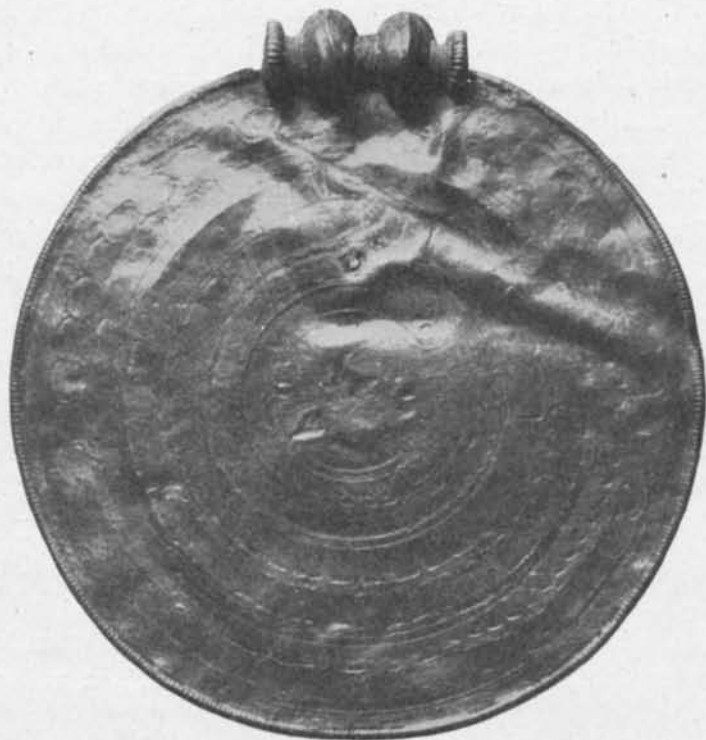
Fig. 102. Baksidan av brakteaten fig. 1. 1 / t .

Större delen av den utskurna gulds kivans periferi omges av en pålödd, pärlad guldtråd, mellan vars ändar den rikt smyckade