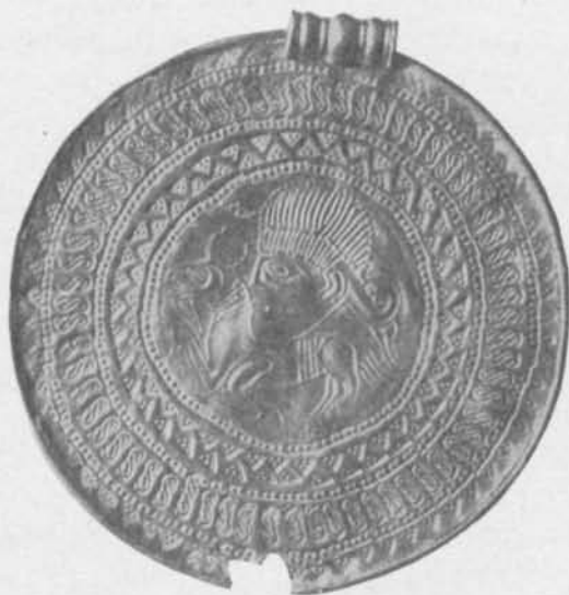
Fig. 113. Guldbrakteat. Lilla Istad, Alböke sn, Öland. S. H. M. 3714. \frac{1}{4} .

och denna andra brakteat (Atlas 145) är från Algutsrums sn på Öland ej långt från Färjestaden, där en av de tre sinsemellan så nära besläktade guldhalskragarna är funnen. Och se vi närmare efter, har Öland även givit två större och några smärre,