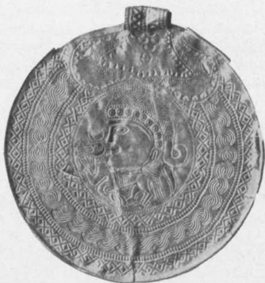
Fig. 107. Guldbrakteat. Vä. Se fig. 6. S. H. M. 67. 1/1.