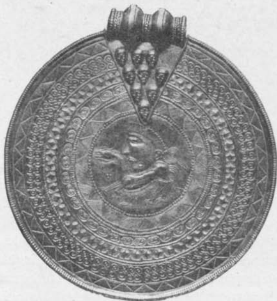
Fig. 105. Guldbrakteat. Ravlunda nära Simrishamn, Skåne. S. H. M. 71. 1/1.