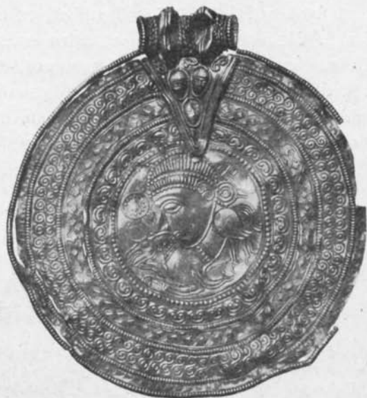
Fig. 104. Guldbrakteat. Dödevi, Högby sn, Öland, S. H. M. 5714. 1/1.