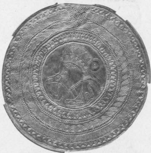
Fig. 106. Guldbrakteat, funnen jämte fig. 7 och 8 m. m. vid Vä, Skåne. S. H. M. 67. 1 / 1 .

De små, påfallande starkt klassiskt formade krigarhuvuden, som ses instämplade över 30 gånger runt Geretebrakteatens mittbild, erbjuda de första till vårt museum förvärvade exemplen på att man till bårddekorerings nyttjat stampar med annat än rent geometriska motiv. I Köpenhamn finnas åtminstone två brakteater med liknande, ehuru grövre huvuden i bårder; den ena