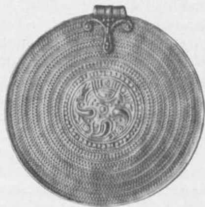
Fig. 115. Guldbrakteat. Gotland. S. H. M. 11150:5. \frac{1}{4} .