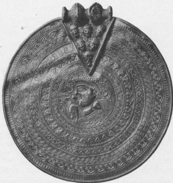
Fig. 101. Guldbrakteaten från Gerete i Fardhems sn, Gotland. S. H. M. 18375. 1/1.

dragna linjer, varav rester ännu skymta här och var mellan bårderna, tydligast utomkring avtrycken av andra bården inifrån. Den punkt, där passarens stillastående ben vilade vid uppdragandet av cirklarna, är lätt skönjbar i brakteatens centrum; på bil-